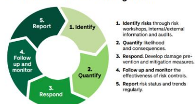
Preems model for risk management

Preems Code of Conduct og en risikobasert tilnærming til leverandørene er utgangspunktet for leverandørvurderingene våre. Dette har vist at innkjøp av biodrivstoff, bioråvare og til en viss grad fossile innsatsfaktorer til produksjonen vår er den delen av virksomheten til Preem som vil være mest utsatt for mulig risiko for kritikkverdige arbeidsvilkår og brudd på menneskerettigheter. Det er med andre ord nødvendig med god kjennskap og oversikt over leverandørleddet. Risikomodellen Preem benytter seg av legger opp til at leverandørene må registreres, vurderes og til slutt godkjennes ut fra et sett med forhåndsdefinerte kriterier før det er mulig å gjøre et innkjøp. Hvis det i denne prosessen avdekkes ett eller flere områder hvor det er risiko for blant annet korrupsjon, kritikkverdige arbeidsforhold eller lignende